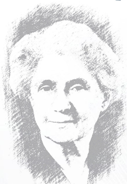
С. А. Рубинштейн

НАУЧНЫЙ ЦЕНТР ПСИХИЧЕСКОГО ЗДОРОВЬЯ ФЕДЕРАЛЬНОЕ ГОСУДАРСТВЕННОЕ БЮДЖЕТНОЕ НАУЧНОЕ УЧРЕЖДЕНИЕ