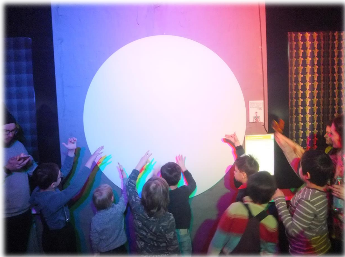
Видеосамо моделирование: поощрение и обмен эмоциями