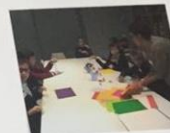
Мастер-класс по созданию визуального искусства