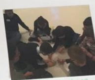
Композиция из кристаллов