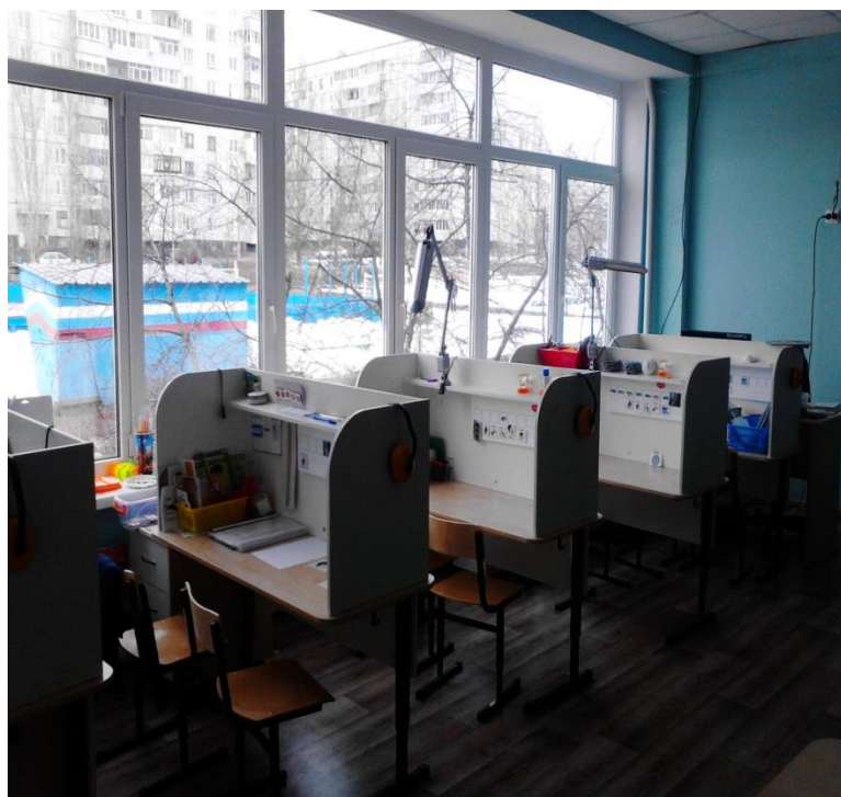
Зона для индивидуальных занятий