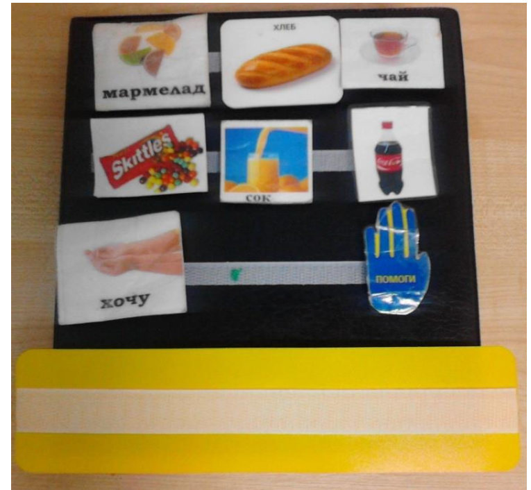
Использование коммуникативной книги PECS