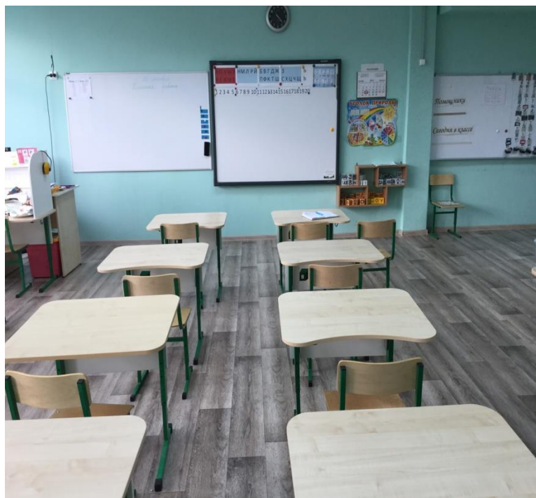
Зона для групповых занятий