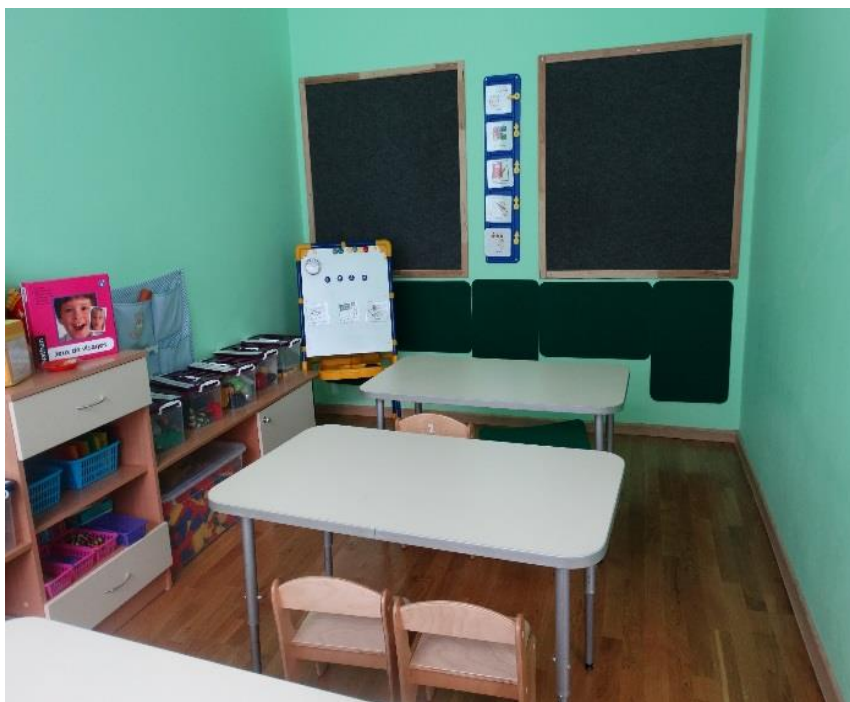
зона групповых занятий